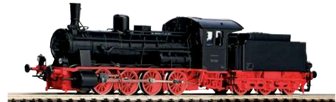
47104 Dampflok BR 55 DB Ep. III 263,00 €*