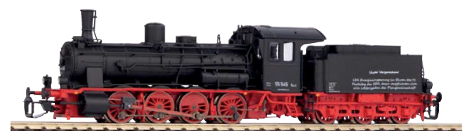
47107 Dampflok BR 55 Parteitag DR Ep. III 263,00 €*