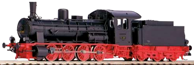
47108 Dampflok BR 55 DRG Ep. II 263,00 €* Mit TT Kurzkupplung!