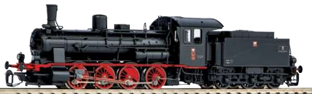
47105 Dampflok BR 55 PKP Ep. III 288,00 €*