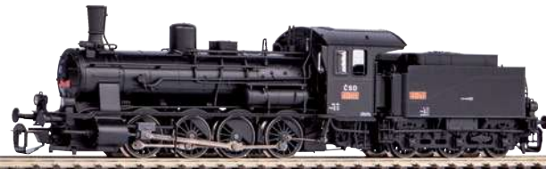
47103 Dampflok BR 413.073 ČSD Ep. II-III 288,00 €*