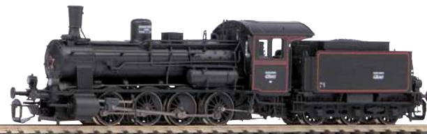
47106 Dampflok BR 431 MÁV Ep. III 288,00 €*